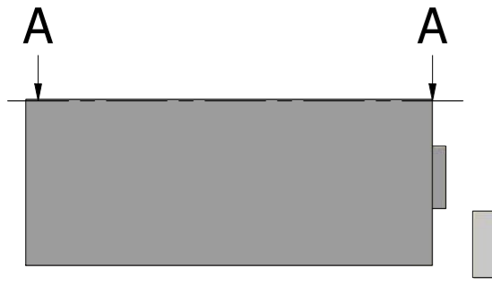
A-A ( 1 : 20 )